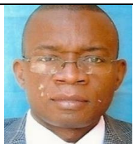
Professeur MWEMBO TAMBWE