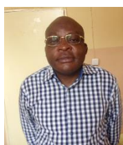
Professeur OZOZA OKOLOKEN